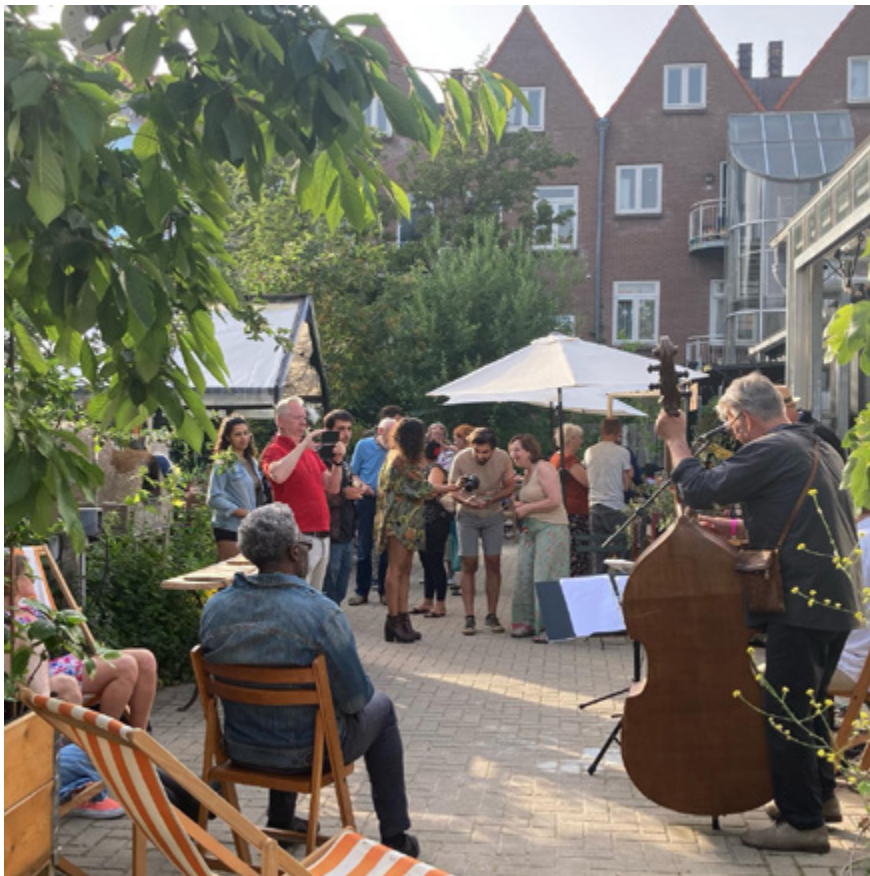
Stadsoase Spinozahof, Den Haag